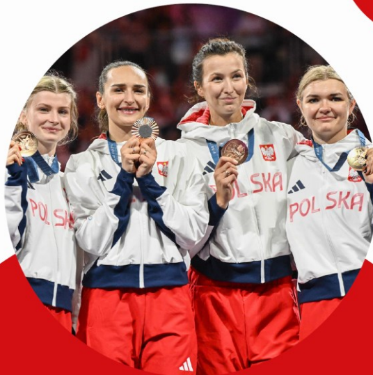
Brązowe medalistki Igrzysk Olimpijskich w Paryżu - szpada drużynowo